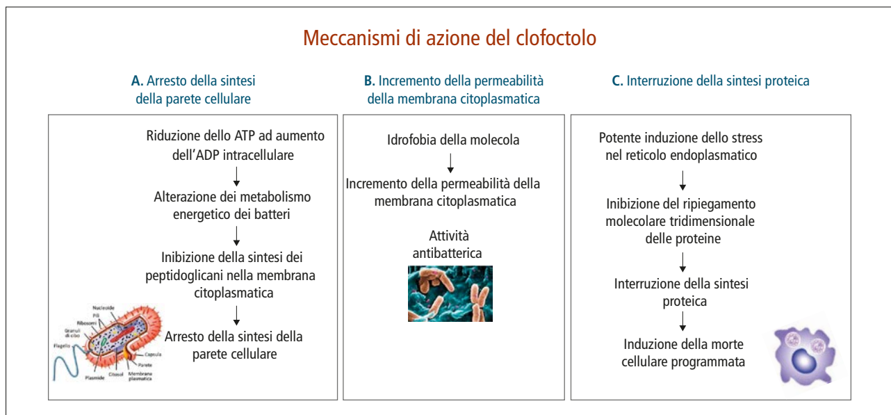
Figura 1. I meccanismi di azione del clofoctolo che ne caratterizzano l'effetto antimicrobico.

Il clofoctolo è un farmaco che, nella pratica clinica, viene somministrato esclusivamente per via rettale sotto forma di supposte. La via rettale può essere considerata una buona alternativa alla somministrazione orale per la popolazione pediatrica in quanto queste forme farmaceutiche, non dovendo essere ingerite, non hanno il problema di dover mascherare un gusto non gradito 9 . Le supposte presentano il vantaggio di poter essere somministrate anche in emergenza, specie nei bambini poco collaboranti e/o che presentano nausea e vomito. Il clofoctolo dimostra di possedere un'azione prevalentemente battericida su diversi germi Gram-positivi, in particolare sullo Streptococcus pyogenes e sullo Streptococcus pneumoniae , ma anche sul Corynebacterium spp e sullo Propionibacterium acnes (figura 2A). L'efficacia dell'attività antibatterica è dovuta alla forte affinità di legame che questi germi possiedono nei confronti della molecola 10-12 . L'azione sui Gram-negativi si esplica su poche specie batteriche, come lo Haemophilus influenzae , la Bordetella spp. e la Neisseria meningitidis , che rappresentano comunque i più importanti e frequenti patogeni respiratori in questo gruppo (figura 2B) 10-15 . Infine, il clofoctolo dimostra di essere attivo su alcuni ceppi batterici resistenti, come lo Staphylococcus aureus (ceppi ATCC 11632, ATCC 23 13 301, ATCC 27 660, CIP 64 54) e lo Streptococcus faecalis (ceppo ATCC 14 508) (figura 2C) 1 , e più recentemente è stata